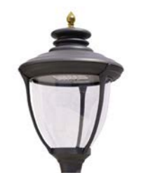
Difusor transparente ref. TR