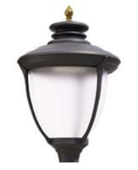
Difusor translúcido ref. FR