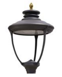
Vidrio plano ref. LSE6