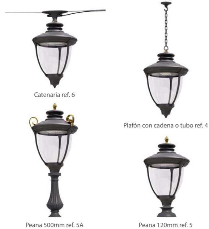
Catenaria ref. 6