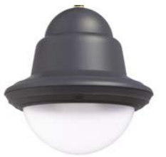
Difusor translúcido ref. FR