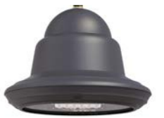
Vidrio plano ref. LA2