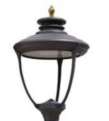
Vidrio plano ref. LSE6