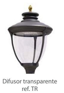
Difusor transparente ref. TR