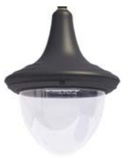
Difusor transparente ref. TR