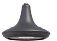
Vidrio plano ref. LA