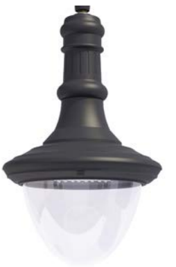
Difusor transparente ref. TR