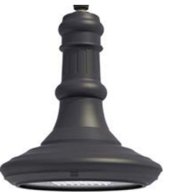
Vidrio plano ref. LA4