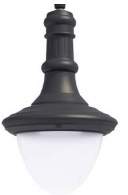
Difusor translúcido ref. FR