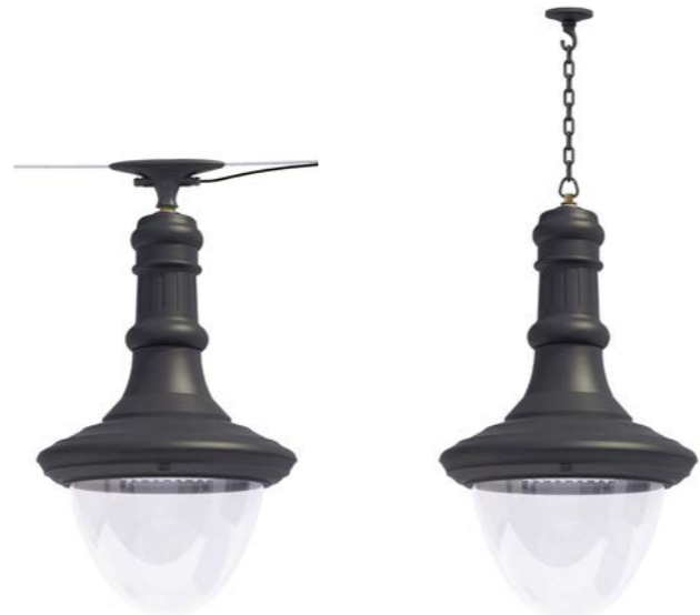
Catenaria ref. 6