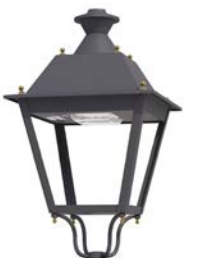
Sin difusores ref. ND