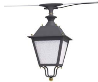
Catenaria ref. 6