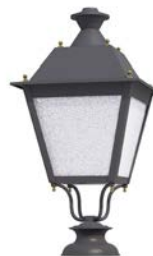
Peana 120mm ref. 5