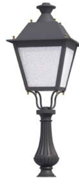
Peana 500mm ref. 5A