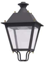
Difusor transparente ref. TR