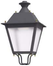
Difusor translúcido ref. FR