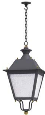
Plafón con cadena o tubo ref. 4