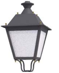
Difusor rugoso ref. DR