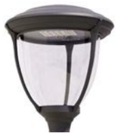
Difusor transparente Ref. TR