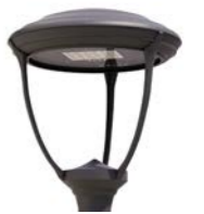
Vidrio plano Ref. LCE3