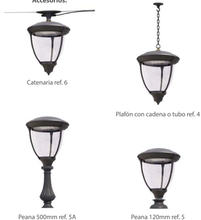
Catenaria ref. 6