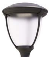
Difusor translúcido Ref. FR