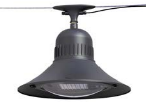
Catenaria ref. 6