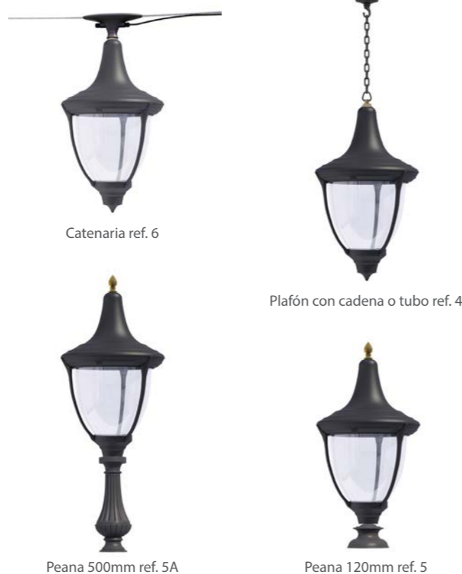
Catenaria ref. 6