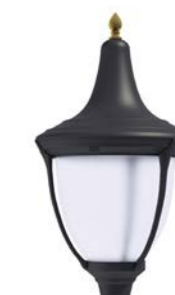
Difusor translúcido ref. FR