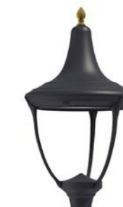
Vidrio plano ref. LJ3