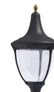
Difusor transparente ref. TR