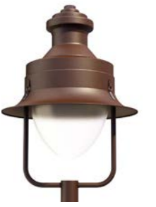
Difusor translúcido ref. FR