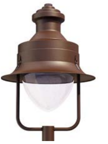
Difusor transparente ref. TR