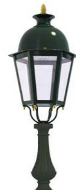
Peana 500mm ref. 5A