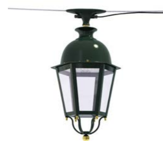
Catenaria ref. 6