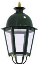
Difusor transparente ref. TR