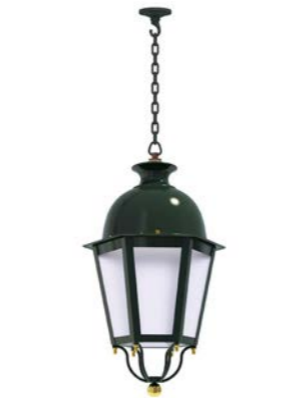
Plafón con cadena o tubo ref. 4