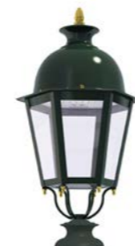
Peana 120mm ref. 5