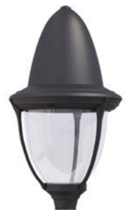
Difusor transparente ref. TR