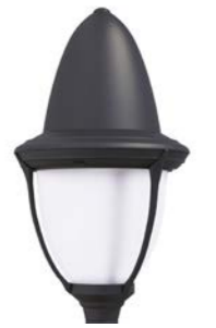
Difusor translúcido ref. FR