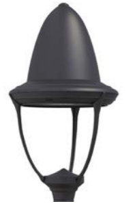
Vidrio plano refs. LB-V3 y LB3