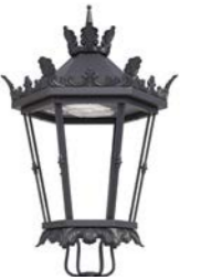
Sin difusores ref. ND