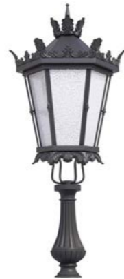
Peana 500mm ref. 5A