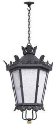
Plafón con cadena o tubo ref. 4