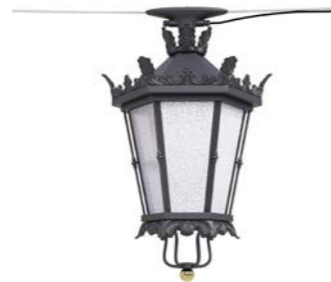
Catenaria ref. 6