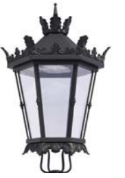
Difusor transparente ref. TR