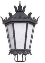
Difusor rugoso ref. DR