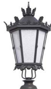
Peana 120mm ref. 5