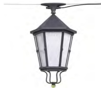
Catenaria ref. 6