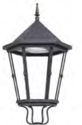
Sin difusores ref. ND