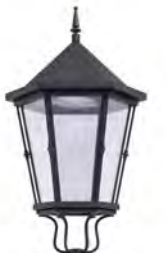
Difusor transparente ref. TR