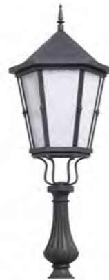
Peana 500mm ref. 5A