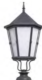
Peana 120mm ref. 5