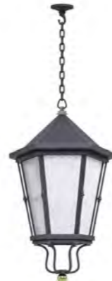
Plafón con cadena o tubo ref. 4