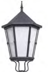
Difusor rugoso ref. DR