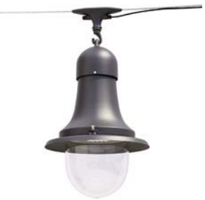
Catenaria ref. 6