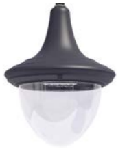
Difusor transparente ref. TR