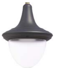
Difusor translúcido ref. FR