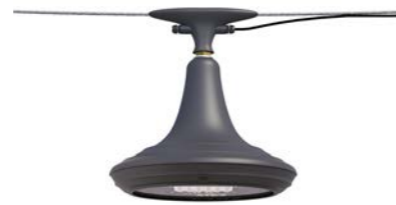
Catenaria ref. 6