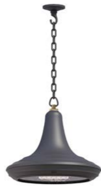
Plafón con cadena o tubo ref. 4