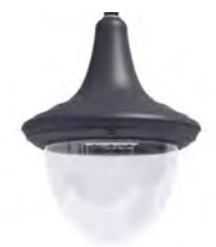
Difusor transparente ref. TR