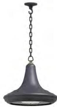
Plafón con cadena o tubo ref. 4