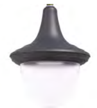
Difusor translúcido ref. FR