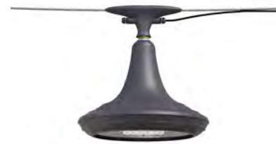
Catenaria ref. 6