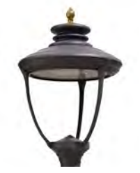
Vidrio plano ref. LSE6