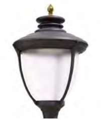
Difusor translúcido ref. FR