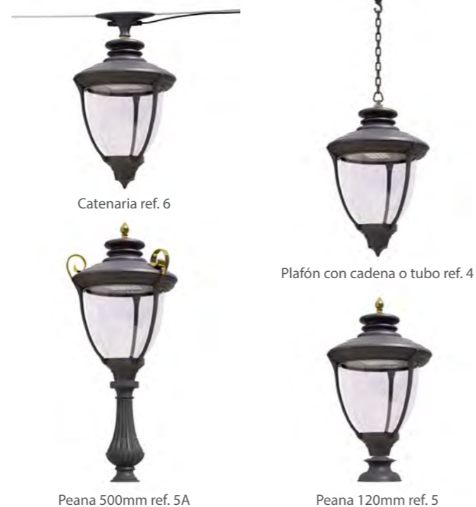
Catenaria ref. 6