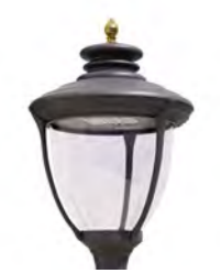
Difusor transparente ref. TR