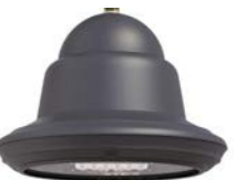
Vidrio plano ref. LA2