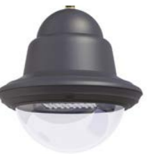
Difusor transparente ref. TR