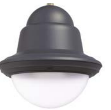
Difusor translúcido ref. FR