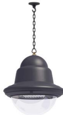
Plafón con cadena o tubo ref. 4