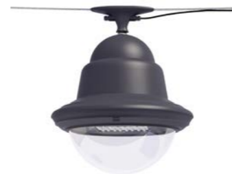
Catenaria ref. 6