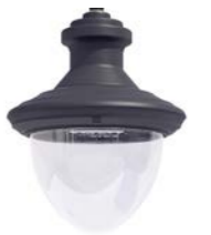
Difusor transparente ref. TR