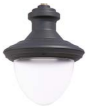
Difusor translúcido ref. FR