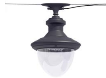
Catenaria ref. 6