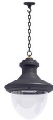
Plafón con cadena o tubo ref. 4