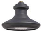
Vidrio plano ref. LA3