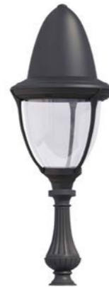
Peana 500mm ref. 5A