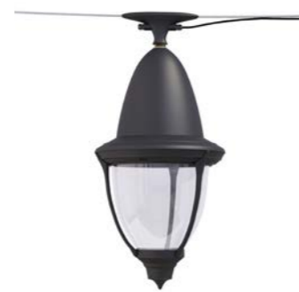
Catenaria ref. 6