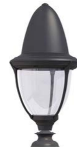
Peana 120mm ref. 5