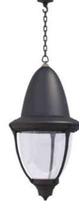
Plafón con cadena o tubo ref. 4