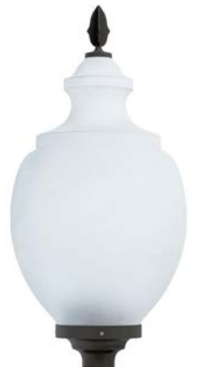
Difusor opal ref. OP