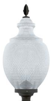
Difusor transparente grabado prismático ref. PR