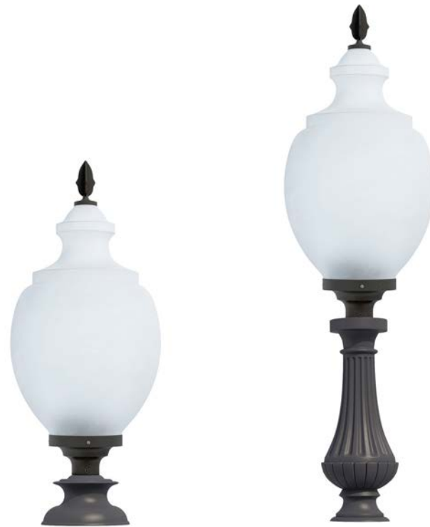
Peana 120mm ref. 5