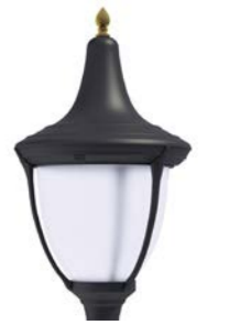
Difusor translúcido ref. FR