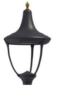
Vidrio plano ref. LJ3