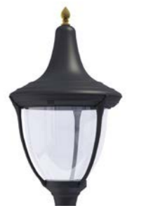
Difusor transparente ref. TR