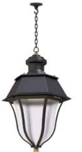
Plafón con cadena o tubo ref. 4