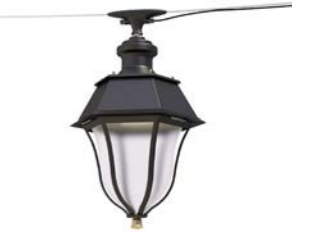
Catenaria ref. 6