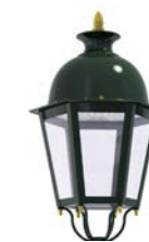
Difusor transparente ref. TR