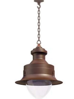
Plafón con cadena o tubo ref. 4