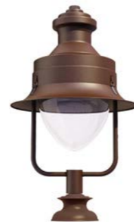
Peana 120mm ref. 5