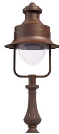
Peana 500mm ref. 5A