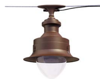
Catenaria ref. 6